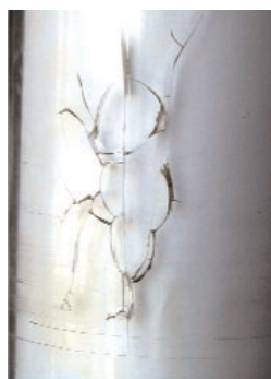
Haarrisse entstehen z.B. durch chemische Reinigungsmittel